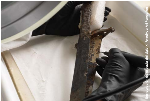
Restauración de espada del siglo X. Fundación Art Fundación

El curso tiene como objetivo potenciar la utilización de las tecnologías de la información y comunicación en su aplicación a la difusión e interrelación de proyectos e investigaciones en materia de patrimonio cultural, en especial del campo de la conservación, restauración e investigación como metodología de puesta en valor.