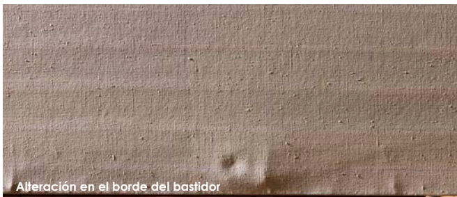
Alteración en el borde del bastidor

Pese a los daños anteriormente señalados, la obra presentaba un buen estado de conservación.