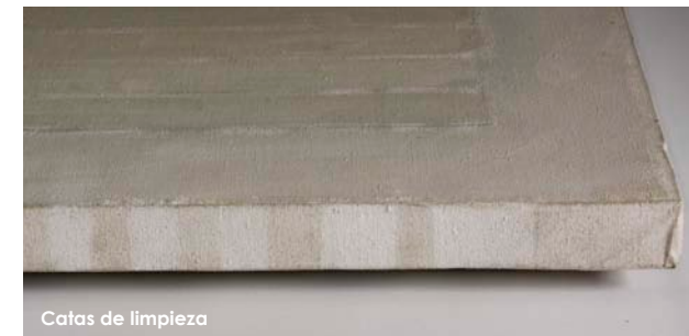
Catas de limpieza

Tras corregir varias deformaciones del soporte textil localizadas en la parte inferior mediante humedad controlada y pesos, se realizó un tensado de la obra y se instaló una trasera ventilada como protección del reverso de la obra, a fin de amortiguar las oscilaciones termohigrométricas y su efecto sobre el soporte.