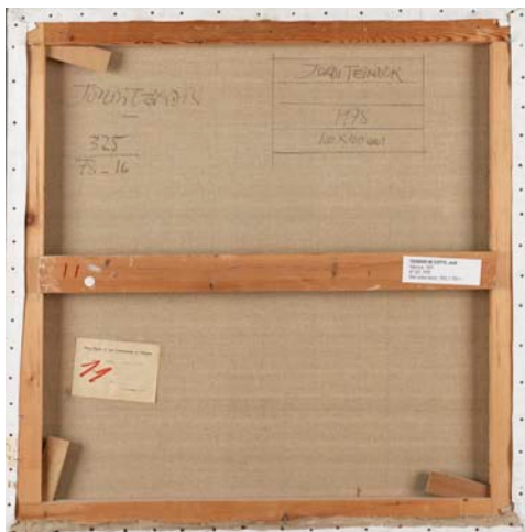
Reverso del lienzo