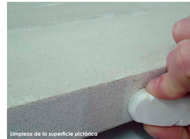
Limpieza de la superficie pictórica