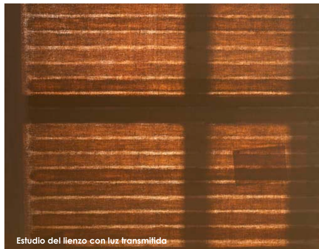
Estudio del lienzo con luz transmitida

Sección estratigráfica obtenida con microscopía óptica con lámpara de Wood de una zona blanca. Se observa (1) Capa de preparación blanca compuesta de litopón (2) Capa blanca compuesta de litopón (3) Capa blanca compuesta de blanco de zinc y blanco de titanio (4) Capa blanca delgada compuesta de blanco de zinc, blanco de titanio y albayalde (5) Capa delgada de naturaleza orgánica.