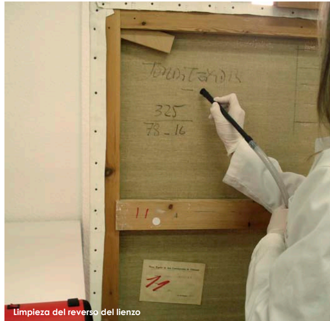
Limpieza del reverso del lienzo