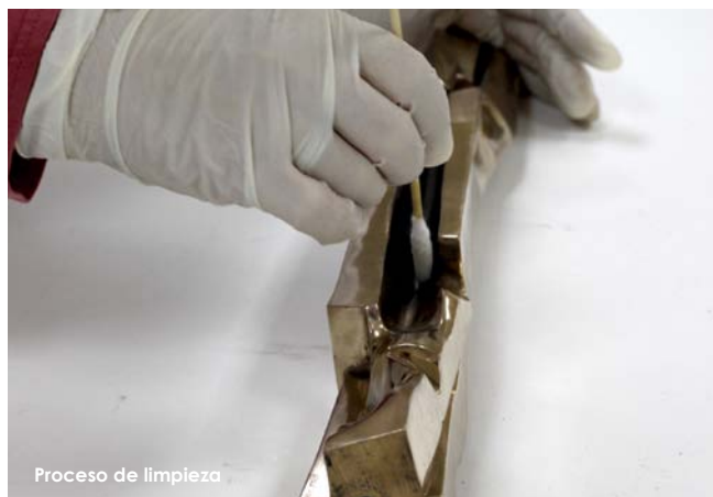
Proceso de limpieza

La peana es un soporte realizado con una plancha metálica de acero recubierta por una fina capa de cinc.