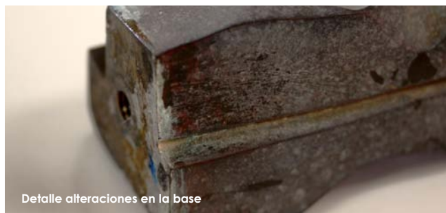
Detalle alteraciones en la base