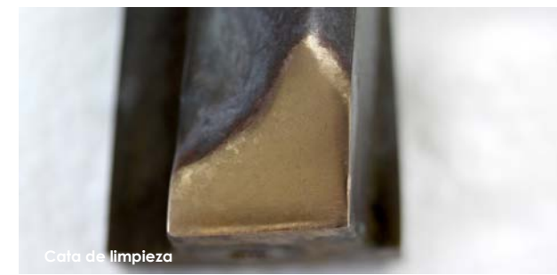
Cata de limpieza