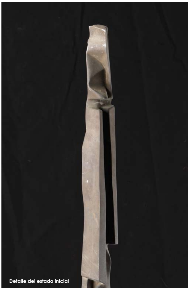
Detalle del estado inicial

aquella forma, si esto o aquello es bello, justo o bueno. Algunas con significado explícito (cruces) otras están asociadas o disociadas (no he visto nada más individualista que una bandera junto a otras). En mi obra yo he querido humanizar estos sistemas contruidos por el hombre pero que también escapan a su control. Estas esculturas progresivas -me dijera un día Eduardo Westerdahl- se componen de varias clases de elementos volumétricos y de vacíos. Los volúmenes están superpuestos, adosados unos a otros o se transforman aunque también pueden surgir cortes abruptos, grietas y ondulaciones. Los vacíos semitubulares pueden ser caminos de luz en ocasiones amenazados por un volumen oscuro, otras veces esos caminos son sendas ciegas, intransitables, amargas. Algunas obras son patinadas en el exterior y la senda es brillante, en otras el exterior es pulido y patinado el hueco principal, quedando la parte oscura reservada al hombre como algo muy hondo y estrecho. Hoy pienso que estas antenas transmisoras que hacía en aquellos años se referían al poder y al pueblo como sobreviviente del poder, en un diálogo cifrado para el común de los mortales y jeroglífico para el pueblo, mientras el pueblo trabaja el poder conspira, por debajo del nivel del poder la comunicación real es difícil." Pablo Bartolomé Serrano