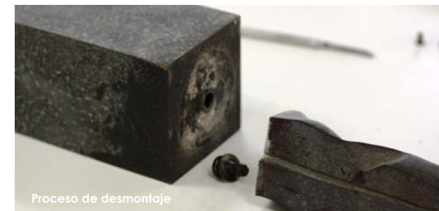
Proceso de desmontaje