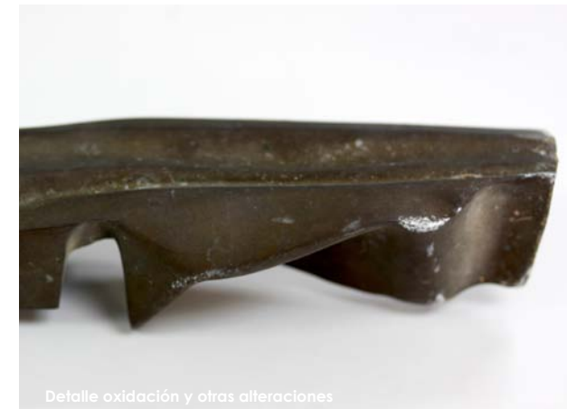
Detalle oxidación y otras alteraciones

En cuanto a la peana, tras eliminar la suciedad y la herrumbre, se nutrió con una capa cera microcristalina pigmentada.