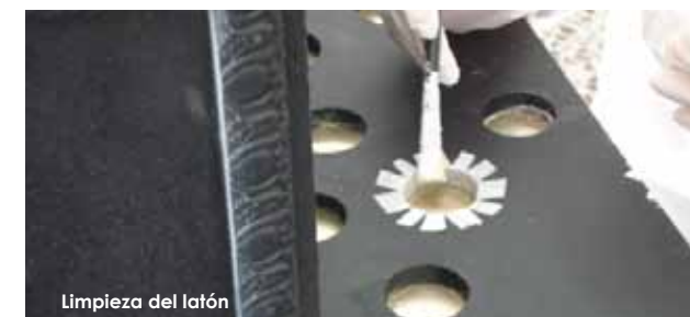
Limpieza del latón