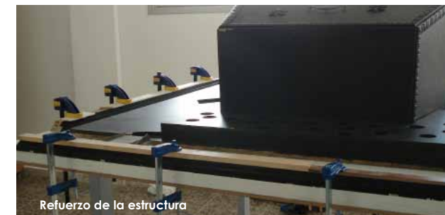
Refuerzo de la estructura

A fin de estabilizar los elementos metálicos se llevó a cabo una primera limpieza físico-mecánica seguida de una limpieza química. Se aplicó un tratamiento inhibidor para posteriormente proteger el material.