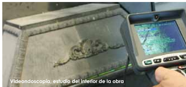
Videodoscopia, estudio del interior de la obra