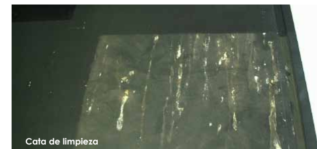
Cata de limpieza

Tras realizar varias pruebas de limpieza y consultar al artista, la prenda textil fue sustituida por otra nueva, más acorde con el concepto de la obra. Esta se sujetó sobre la parte superior mediante discos de velcro.