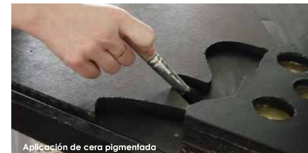
Aplicación de cera pigmentada